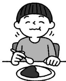
よく噛んで食べる 唾液は歯のガードマン

さい ぼん いじよう しぶん は たも いしき つづ は けんこうしゆうかん 80歳で20本以上の自分の歯を保つために、意識して続けよう歯の健康習慣！