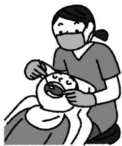
定期的に歯科医院で 歯の健康チェック！