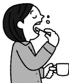
寝ている間に増える歯垢 寝る前の歯みがきが大事