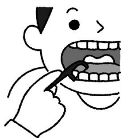
歯間ブラシやフロスも使って 歯と歯の間もきれいに